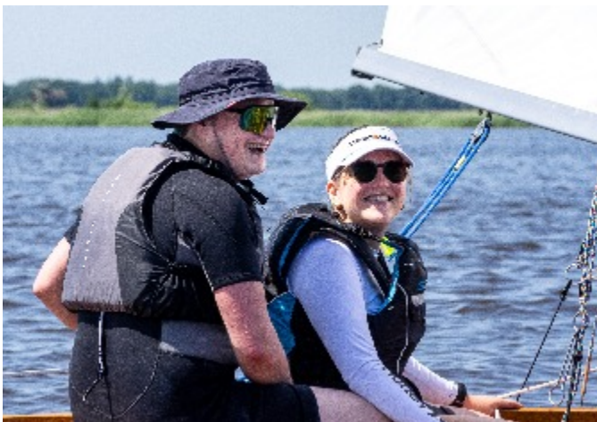
Evenement 2025 Zuidlaren