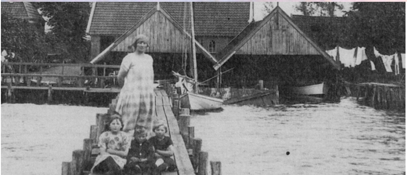
Rechts in het botenhuis ligt waarschijnlijk de Olympia

Naar een knikspant ontwerp van H.C.A. van Kampen werd de Olympia in 1917 door W. Helder en Jaap Helder (toen 10 jaar) in Paterswolde gebouwd.